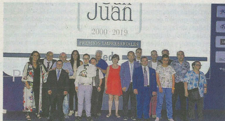
Imagen de la pasada edición de los Premios San Juan de FEDA.

La convocatoria se llevará a cabo con el compromiso de las instituciones y entidades que forman parte de elenco de colaboradores de los Premios Empresariales San Juan: CaixaBank, BBVA, Banco Sabadell,